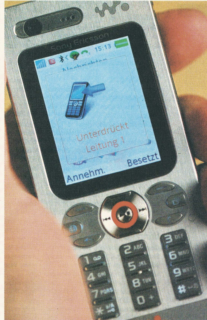
Jeder Handybesitzer kennt das inzwischen. Eine unterdrückte Rufnummer am Display verheißt meistens nichts Gutes.

Das Misstrauen fängt teilweise schon an, wenn eine unterdrückte Nummer am Handydisplay erscheint. Das wissen allerdings auch die Abzocker. Neuester Trick: „Es wird mit gefälschten Rufnummern gearbeitet, um Seriosität zu erwecken.“ Eines gilt jedoch immer: wehren, nicht zahlen. Der VPT ist unter 0800/810 833 zu erreichen.